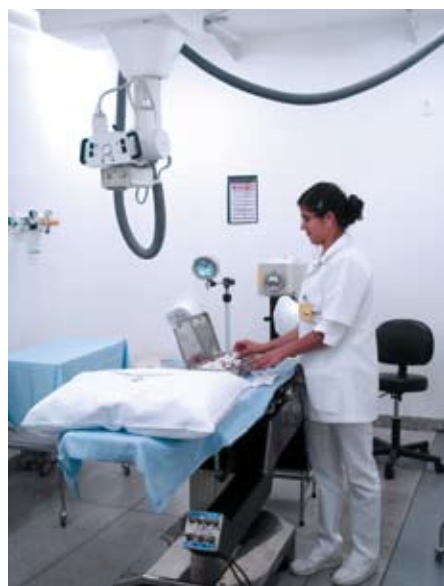
Sala de braquiterapia do Luxemburgo

Mário Penna eles compõem 100%); carentes ou totalmente sem recursos (como os hóspedes da Casa de Apoio Beatriz Ferraz, que congrega lares para crianças e adultos); ou de convênios e particulares (atendidos no Hospital Luxemburgo, onde mais de 60% do total das consultas, cirurgias, internações e terapêuticas com quimioterapia, radioterapia e medicina nuclear se destinam ao SUS).