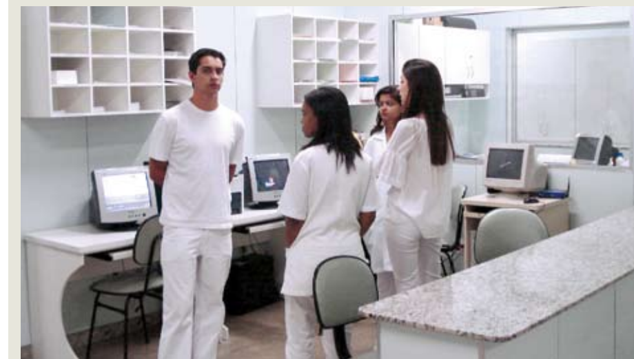
Integrantes do Corpo Clínico