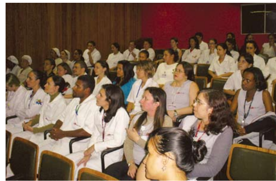
Semana de enfermagem